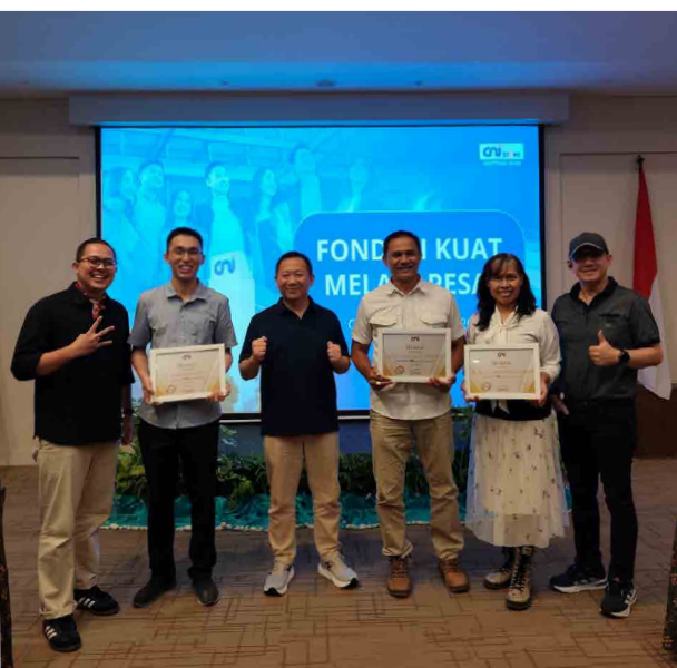
CNI-Store Meeting 2026 juga menjadi ajang penyerahan sertifikat kepada para pemilik CNI-Store