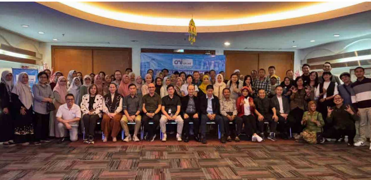
CNI-Store Meeting 2026 dimulai dari Jakarta pada Selasa, 07 April 2026 di C3 Building CNI