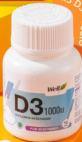
Well3 D3 1000IU