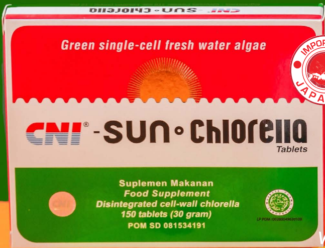
CNI Sun Chlorella