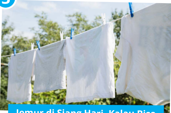
Jemur di Siang Hari, Kalau Bisa

Cuci dan jemur baju di bawah matahari agar cepat kering dan bebas bau. Jika tidak memungkinkan, gunakan SC88 Liquid Detergent dengan formula MOF yang membasmi kuman, sehingga cucian tetap higienis meski dijemur di dalam ruangan.