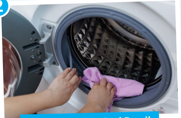
Pastikan Mesin Cuci Bersih

Mesin cuci yang kotor justru bisa jadi penyebab baju bau apek. Bakteri dan jamur yang menempel di mesin bisa nempel ke baju, jadi pastikan mesin cucimu selalu bersih dan bebas dari kuman.