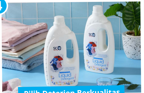
Pilih Deterjen Berkualitas

Cuaca lembab bikin baju lama kering dan mudah bau apek. Gunakan SC88 Liquid Detergent dengan anti-bakteri dan pH netral untuk cucian yang wangi, higienis, dan aman di kulit.